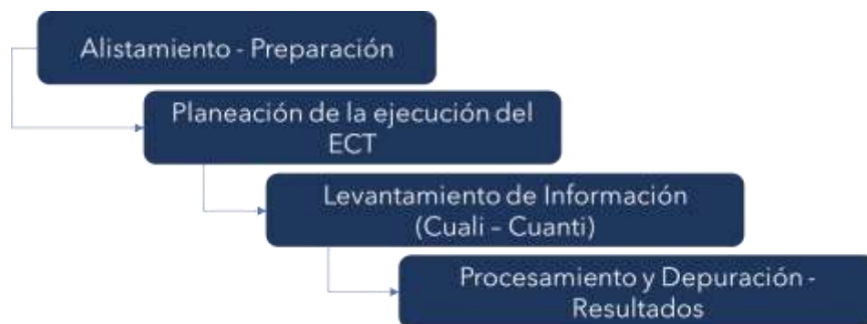
Ilustración 1 Etapas diseño metodológico estudio de cargas de trabajo

Para el cumplimiento de este objetivo, se realizó un diseño metodológico que incluyó cuatro etapas, a saber: